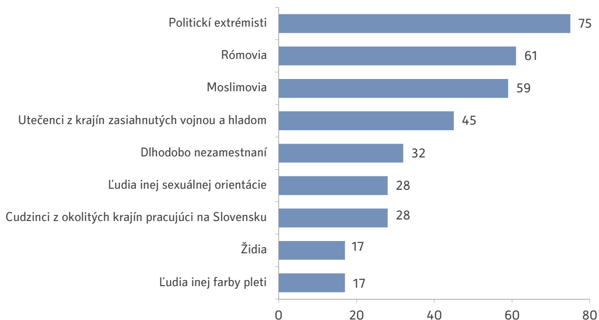
Graf 3: „Predstavte si, že by sa do Vášho susedstva nasťahovala osoba, resp. osoby patriace do nasledujúcich skupín. Prekážali by vám v susedstve, alebo nie?“ (% odpovedí „prekážali by mi“)